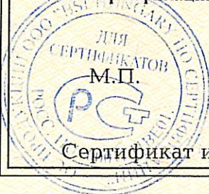
Схема сертификации 9.

Место нанесения знака соответствия: на сопроводительной документации.